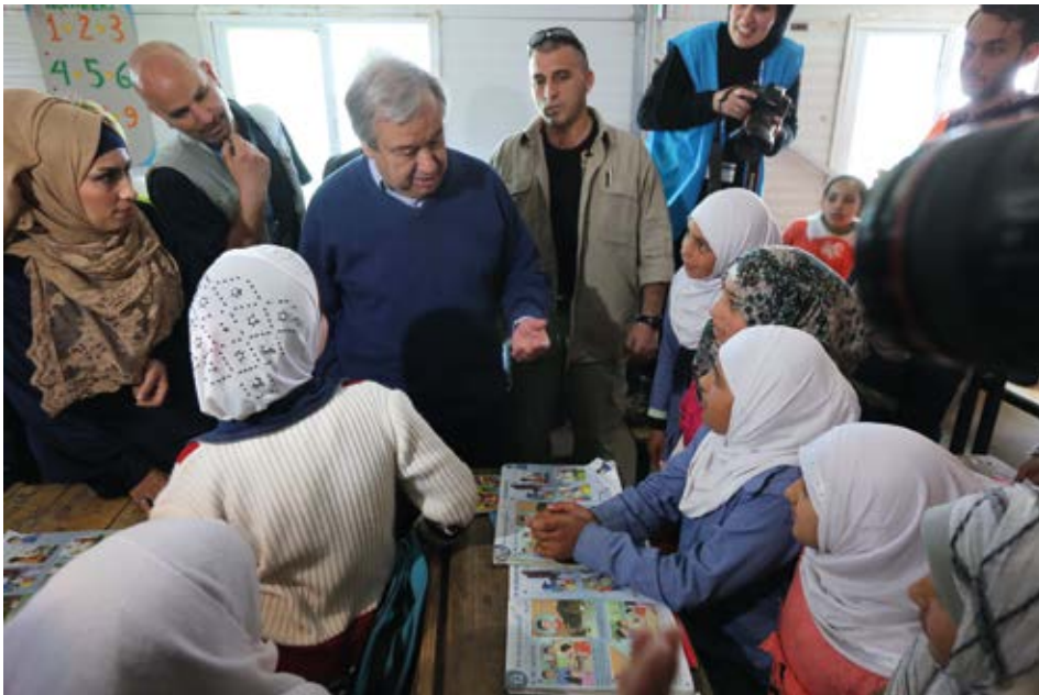
UN-Generalsekretär António Guterres spricht mit Schülerinnen im Flüchtlingscamp Zaatari in Jordanien.

über die Unterstützung der Mitgliedstaaten, eine unstrittige Stellung innerhalb des UN-Systems, persönliche Führungseigenschaften und eine stabile Position innerhalb des diplomatischen Netzwerks verfügen. Diese Kriterien stehen in starker Wechselwirkung mit dem Vertrauen, das der Generalsekretär genießt. Er muss insbesondere das Vertrauen der Sicherheitsratsmitglieder, von denen er nominiert wird, von Beginn an gewinnen. Jener Abhängigkeit vom Sicherheitsrat und der fehlenden Mitsprache der übrigen Staaten sowie der Zivilgesellschaft wirkte man im Auswahlprozess des neuen Generalsekretärs entgegen, indem die Generalversammlung im Jahr 2016 den Nominierungs- und Wahlprozess revolutionierte. In öffentlichen Anhörungen vor der Generalversammlung und in weiteren Gremien mussten sich die Kandidatinnen und Kandidaten gegenüber den Fragen der Öffentlichkeit bewähren.